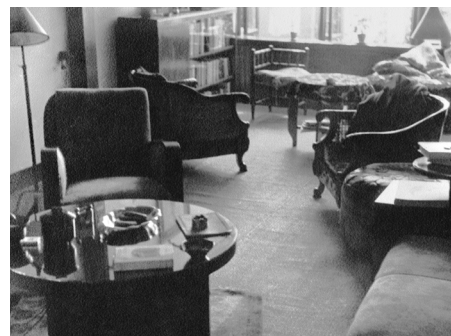
De zitkamer van de Claes de Vrieselaan 21a.

“Het leukst was het onderzoek en de middelste schrijffase. Dan ben je al redelijk zelfbewust en weet je waarheen je wilt, maar je hoeft nog geen puntjes op de i te zetten, wat altijd een monnikenwerk is.”