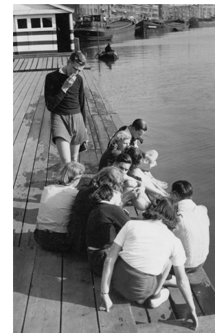
De Keien met vriendinnen bij roeiclub De Maes, 1941.

Ja, deze paradox beschrijft recensent Ernst Arbouw zo treffend in de Volkskrant met “...alsof je als lezer midden tussen de sigarenrook, de jeneverlucht en de kroegjool staat. Daartegenover staat de nerveuze sfeer en permanente, bijna onhoudbare dreiging die als een grondtoon door het boek zoemt. Die krankzinnige, tegengestelde wereld wekt Leeman op knappe wijze tot leven.”