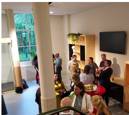
De foto's bij dit artikel zijn van de officiële opening van het gebouw op 15 mei 2024.

Velen hebben gebruik gemaakt van de gelegenheid om hun oude school weer te zien en menigeen betreunde het verlies van de oude sfeer. Dat is een kwestie van tijd: het zweet van de huidige generatie moet er nog even intrekken. •